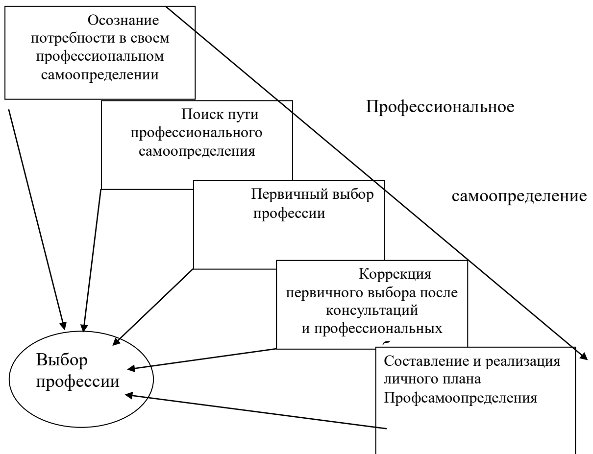
Рисунок 2. Компоненты системы профессионального самоопределения личности на этапе выбора профессии

В начале психологического сопровождения необходимо познакомиться с компонентами системы профессионального самоопределения личности на этапе выбора профессии (Рис.2). Процесс выбора профессии начинается с осознания потребности в профессиональном самоопределении, поиска своего пути. Далее осуществляется первичный выбор профессии, в процессе него, после профессиональной пробы происходит коррекция выбора. Итогом профессионального самоопределения является составление личного перспективного плана.